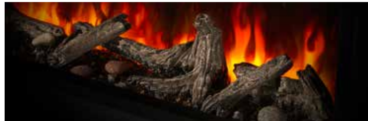
INCLUS : Bûches de bois flotté avec ensemble décoratif Woodland