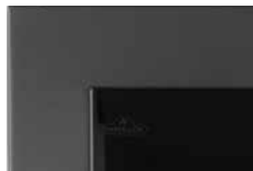
Moulure de finition ajustable incluse (1 pièce)