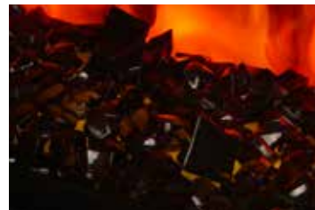
ENSEMBLES DÉCORATIFS OPTIONNELS : Bûches de bouleau, ensemble Mineral Rock, billes de verre, cristaux noirs