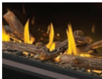
Bûches de chêne haute définition

Recommandé : Combinaison de bûches avec des billes de verre, des braises de verre ou un ensemble d'éléments décoratifs optionnel, ou du verre seul