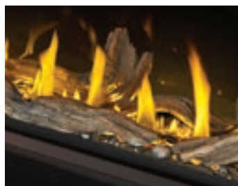
Bûches de bois flotté haute définition