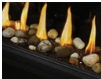
Ensemble Mineral Rock