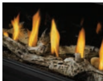
Ensemble Beach Fire