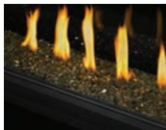
Braises de verre