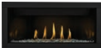
Ascent™ linéaire de luxe