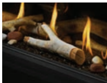
Ensemble de bûches de bouleau