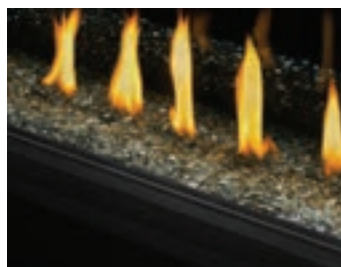
Billes de verre