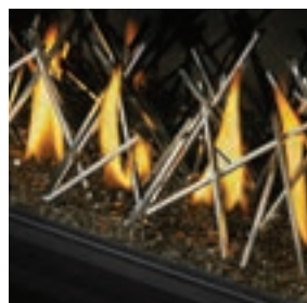
Bâtonnets décoratifs plaqués nickel