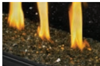
Braises de verre