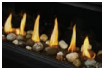
Ensemble Mineral Rock