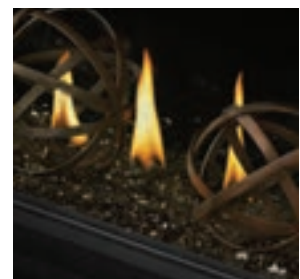
Globes en fer forgé