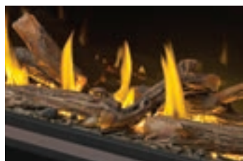
Bûches de chêne haute définition

Recommandé : Combinaison de bûches avec des billes de verre, des braises de verre ou un ensemble d'éléments décoratifs optionnel, ou du verre seul