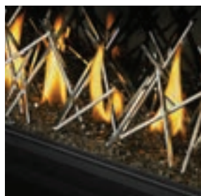
Bâtonnets décoratifs plaqués nickel