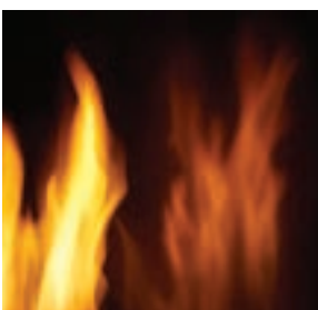
Panneaux réflecteurs radiants en porcelaine MIRO-FLAMME (inclus)