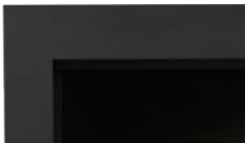
Façade classique noire