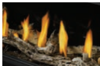
Ensemble Beach Fire