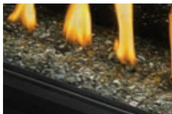
Billes de verre