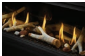
Ensemble de bûches de bouleau