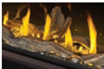
Bûches de bois flotté haute définition